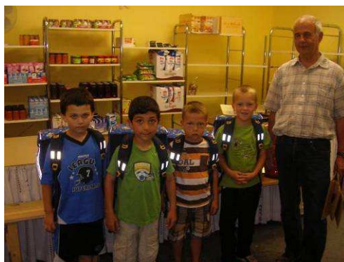
Ausgabe der Ranzen in Swisttal